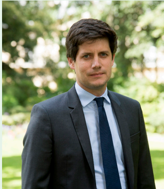
Julien Denormandie, ministre de l'Agriculture et de l'Alimentation

« Un tel recensement est indispensable pour relever les défis qui nous attendent. Nous avons besoin de recueillir des données précises pour observer les mutations des systèmes agricoles français, mesurer l'importance de notre agriculture française au sein de l'Union européenne et déployer toutes les mesures nécessaires pour préparer l'agriculture de demain.